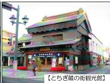
【とちぎ蔵の街観光館】