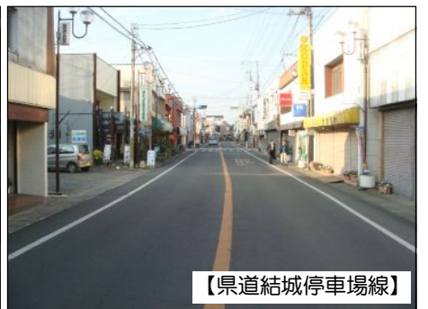
【県道結城停車場線】